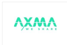
AXMA WE SHARE

Voir la fiche (descriptif, deals, synthèse, équipe...) de :